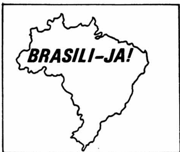
Brasilia Oktober 1987.